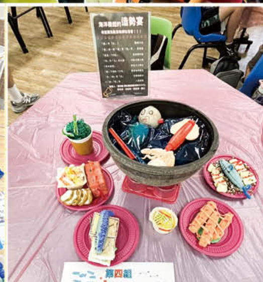
· 海廢辦桌課程成果