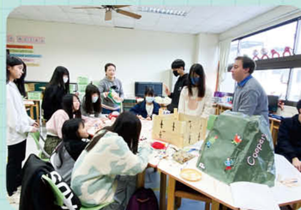
· 外國文化探索 Culture Journey