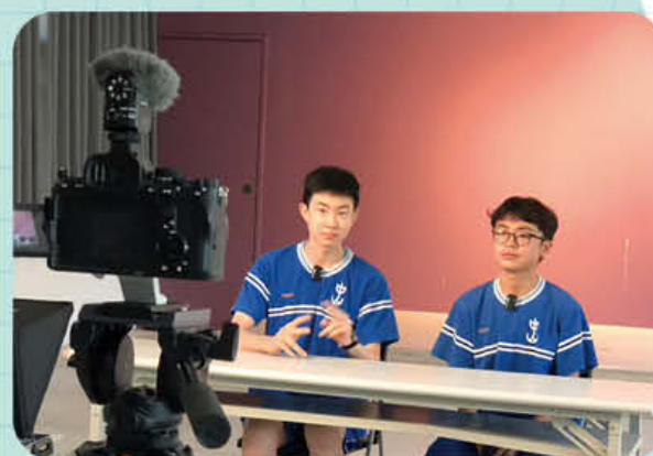
· 英文主播 Junior English Anchor