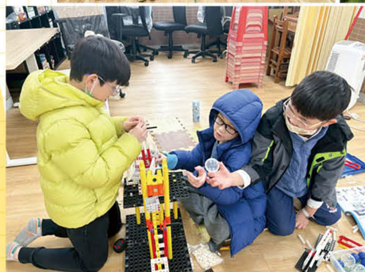
· 機關王課程與競賽